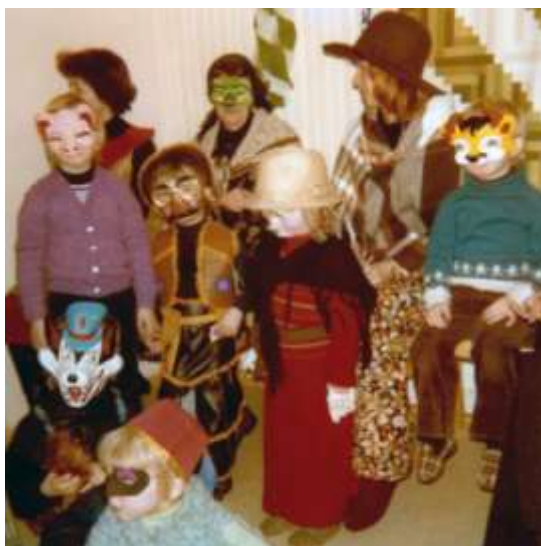
Karnevalsfeiring i barnehagen på slutten av 1970