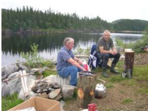
Kaffen vart kokt i svartkjel på ein stor vedkubbe.